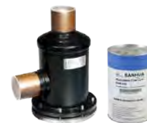
TABELA SELEÇÃO- COM NÚCLEO SH48-A80 Tabela 3